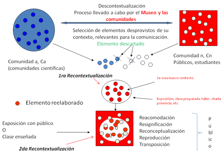
Forma icónica de representación de los procesos de recontextualización que involucra a dos comunidades y al equipo que desarrolla una exhibición o al maestro en el caso de la escuela

El proceso de descontextualización está signado por criterios de selección y control, que a su vez, son expresión de una autonomía relativa del grupo que diseña la exposición (o del docente en el caso de la educación formal). Autonomía relativa configurada por distintas mediaciones: culturales, estatales, interinstitucionales (del entorno como se observó en el museo como institución social), institucionales, grupales e individuales.